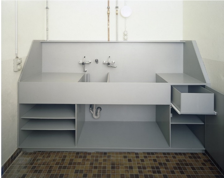
Waschtisch – Kombination aus PVC, nach Kundenwunsch konstruiert, vorgefertigt und montiert

Durch unsere grosse Erfahrung in der Ausführung von Sonderkonstruktionen, im Anlagen und Apparatebau, bieten wir Ihnen auf Ihre Anwendung zugeschnittene Lösungen. Vom Engineering bis zur Installation vor Ort, ist KVA Ihr kompetenter Partner. Die nachstehenden Beispiele bilden nur eine kleine Auswahl unserer Möglichkeiten ab.