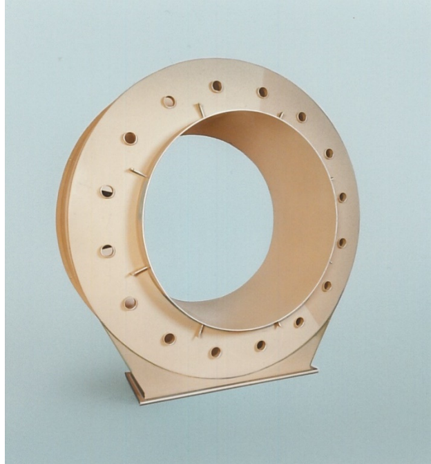
Kundenspezifischer Verteiler aus PP