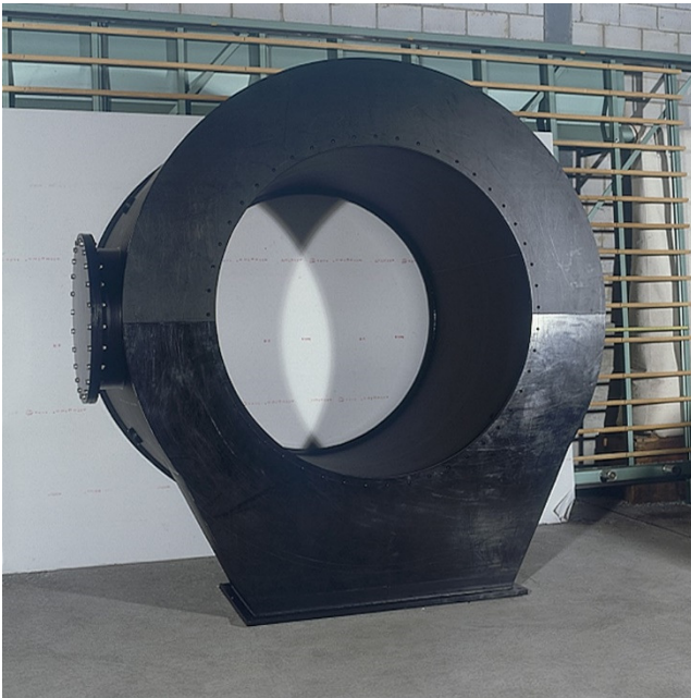
Verteiler aus PE