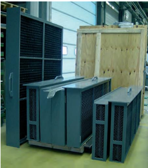
Filterschubladen und Tropfenabscheider versandbereit